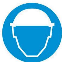
Casco di protezione