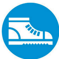
Calzature di sicurezza